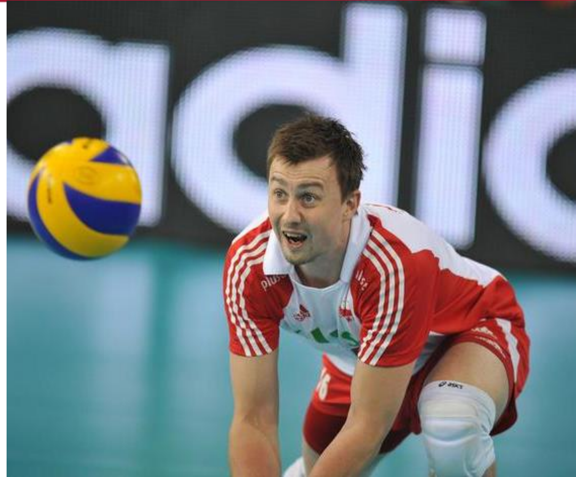
Krzysztof Ignaczak pierwszy libero reprezentacji Polski

Libero to zawodnik, który pełni defensywną funkcję na boisku podczas gry w siatkówkę. Pozycję tę dodano do oficjalnych zasad gry w siatkówkę stosunkowo niedawno – miało to miejsce 1998 roku. Ten zabieg miał na celu uczynić grę w siatkówkę jeszcze bardziej widowiskową i ekscytującą. Pierwszymi zawodami, na których po raz pierwszy na hali pojawił się LIBERO były Mistrzostwa Świata kobiet i mężczyzn, zorganizowane w Japonii w 1998 roku.